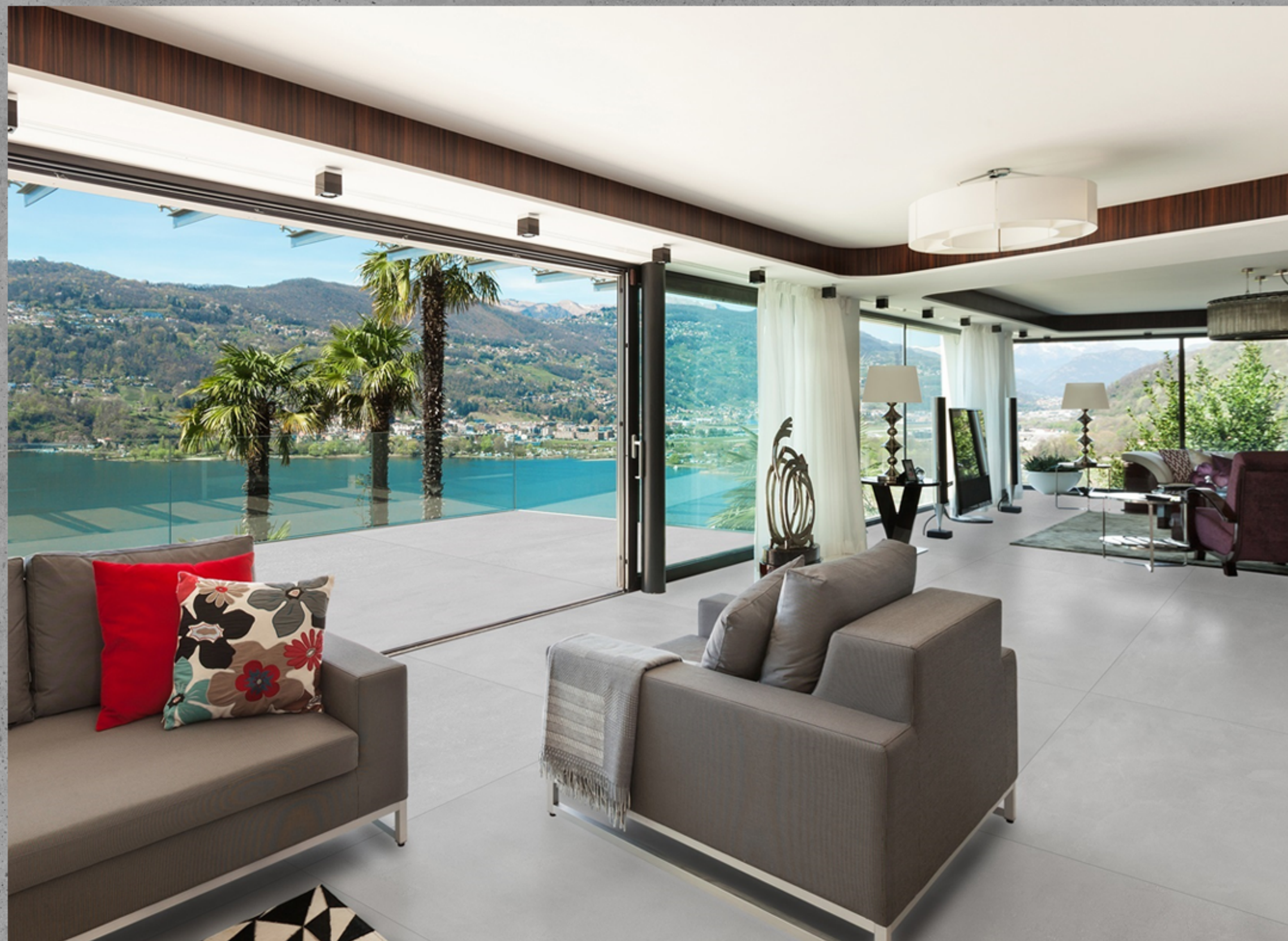
BARCELONA PLATA -84 IN

A Delta conta com mais de 250 produtos no mercado, distribuídos em coleções, cores, formatos e acabamentos diversos, que vão desde os consagrados polidos aos acetinados e rústicos.