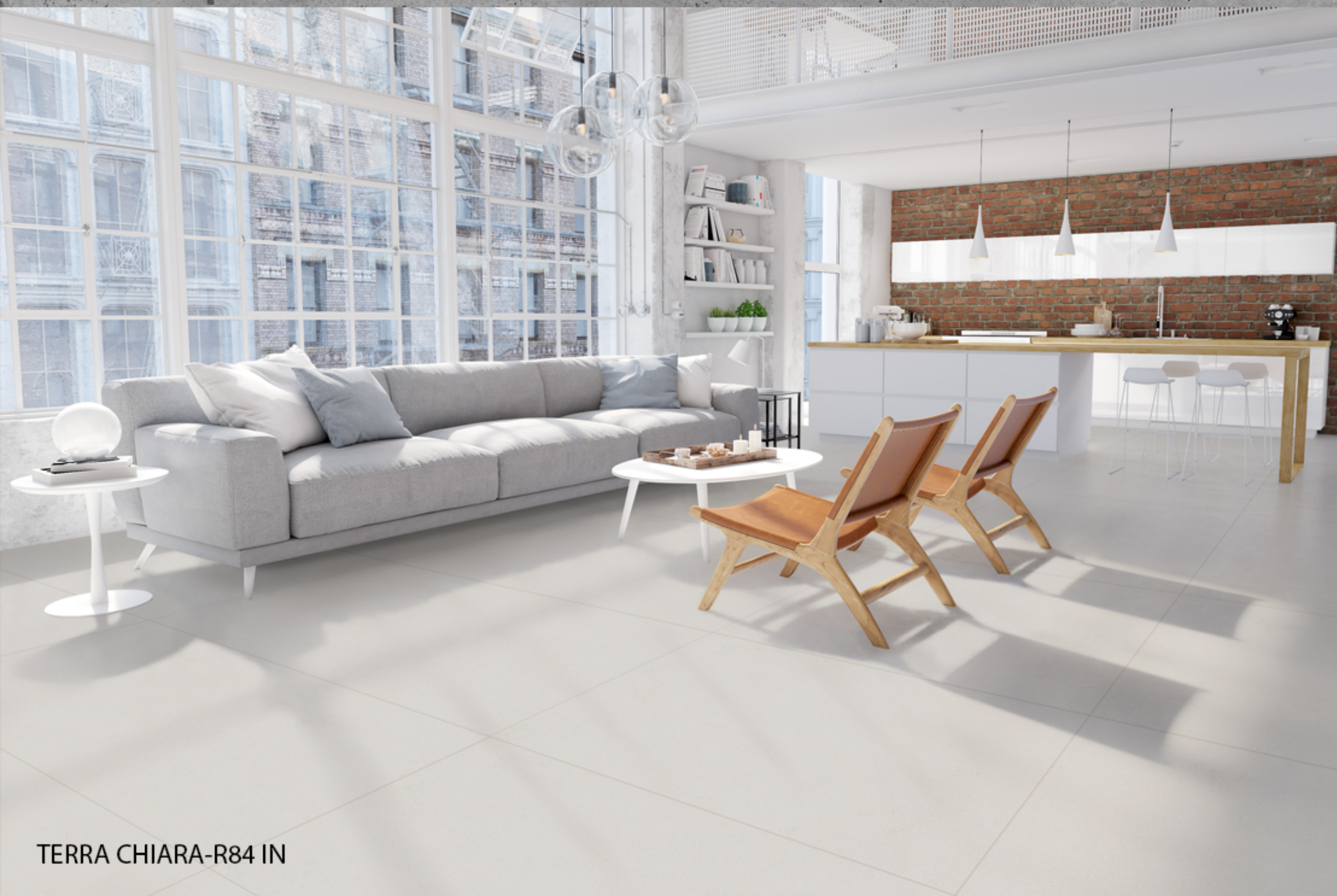
TERRA CHIARA-R84 IN

A Delta em seu vasto mix, oferece, quanto à absorção, as opções de PORCELANATO , GRÊS e SEMI-GRÊS .